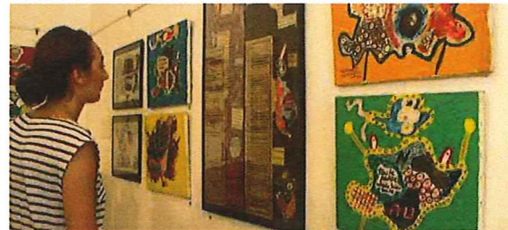
Le musée de l'art brut présente, jusqu'au 2 septembre, une rétrospective du peintre basque espagnol Ignaccio Carles-Tolra, qui fut ami de Jean Dubuffet. Une seconde présentation propose un aperçu du fonds de musée. Entrée gratuite, tous les jours (sauf fêtes).