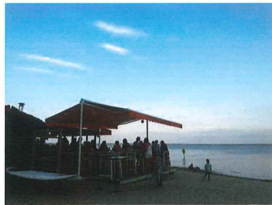
Le calme et la douceur des lumières et de l'atmosphère de la plage de Laouga.

Secret, le mot est fort. Trop fort. Peu connu serait plus juste. La plage de Laouga, située au nord du lac de Cazaux, est un territoire. La route ne va pas plus loin, elle s'arrête ici sans doute parce qu'il faut ensuite laisser la forêt tranquille.