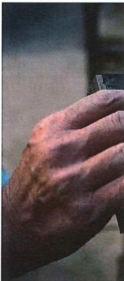
Les pavés sont fabriqués à base d'une argile