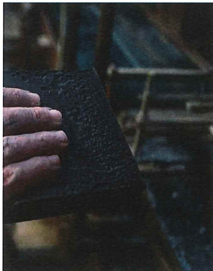
de grès, extraite d'un gisement situé dans la forêt des Landes.