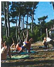
Séance de yoga sur la plage des Américains.

LÈGE-CAP-FERRÉ Premier rendez-vous du mois d'août sur la plage des Américains, sous les pins. Free yoga. Comme free-jazz. On sait quand ça commence, mais pas vraiment comment ça va finir. Ce soir-là, l'association Vivvsurf yoga a donné rendez-vous aux audacieux, aux adeptes d'un corps sain dans un esprit sain, via les réseaux sociaux. L'invitation visait à peu près ceci : « Venez commencer votre voyage de yoga avec moi ou juste me rejoindre pour une pratique sous les pins. Les tapis sont disponibles en nombre limité alors apportez le vôtre ou prenez une serviette ! Tous les niveaux sont les bienvenus et, cette fois, vous payez avec un sourire ou un câlin, vous choisissez ». Un truc gratuit, déjà, au Ferré, c'est une aubaine.